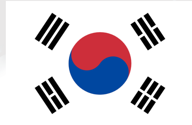
Bandera de Corea